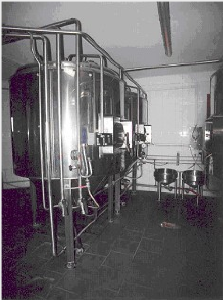
CCCs et bacs de levure