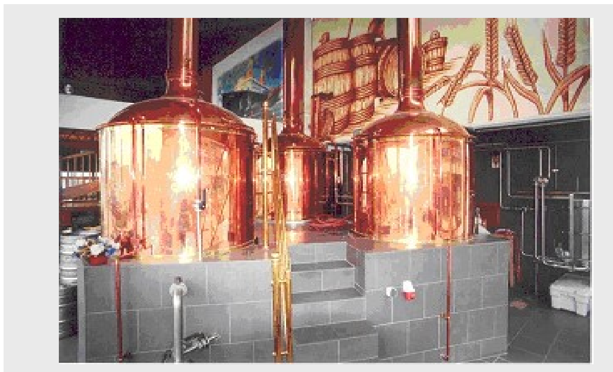
Salle de brassage