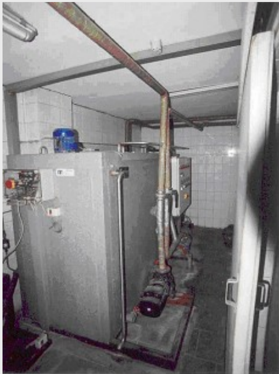
Réservoir d'eau de glace