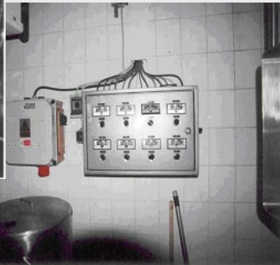
Tanque para controlar la temperatura