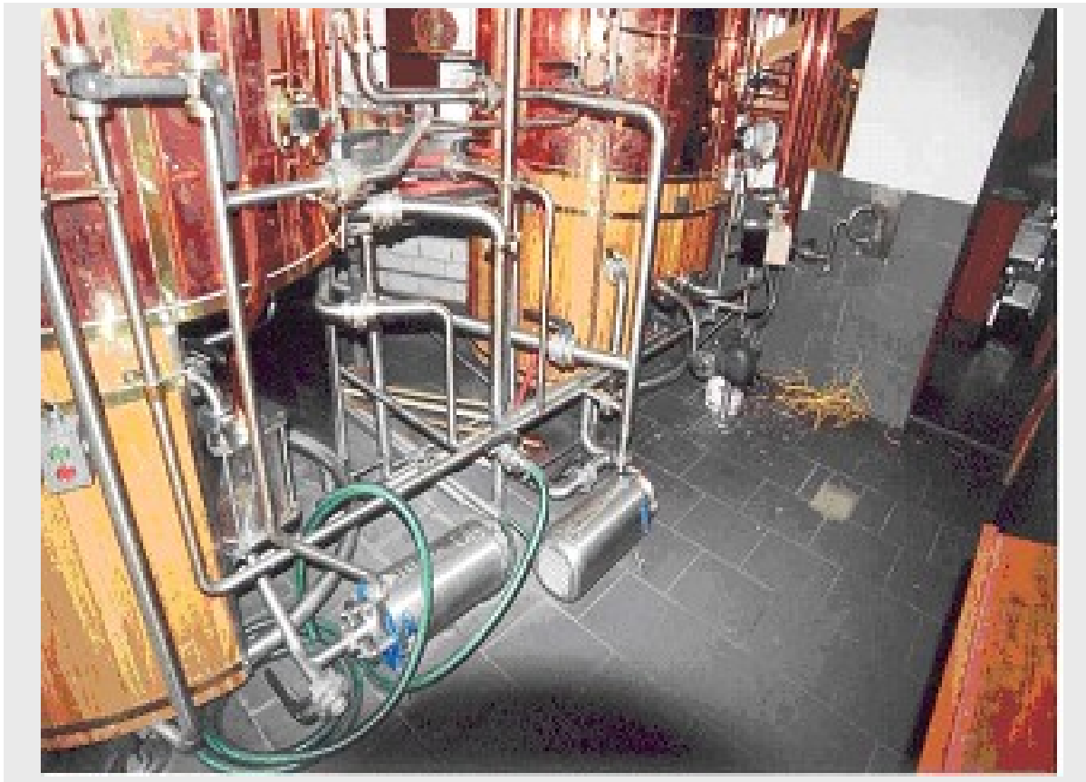
Sala de cocimiento con bomba de macerar y bomba de filtrar