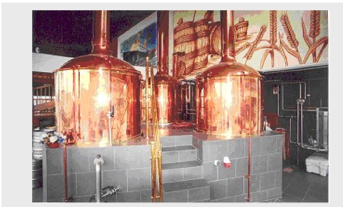
Sala de cocimiento