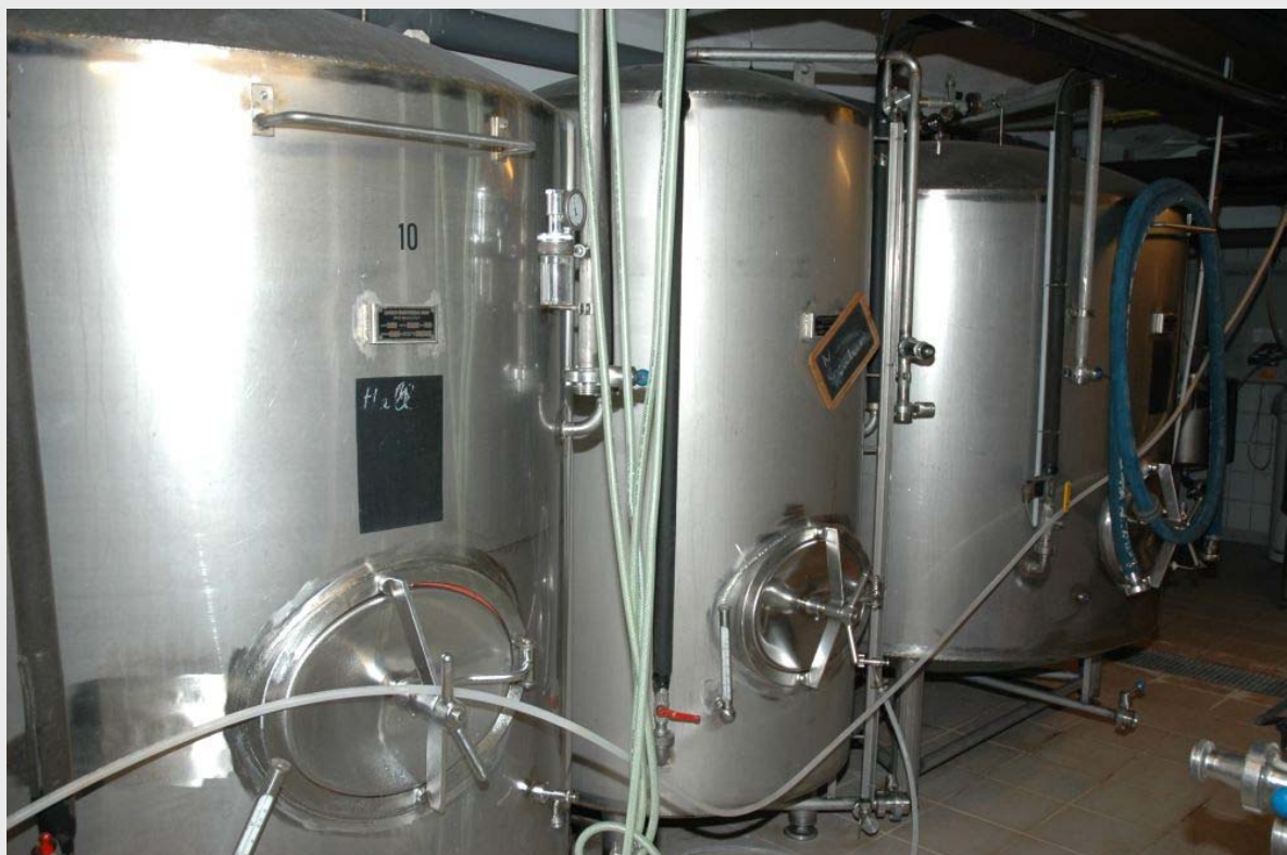
Подвал с танками