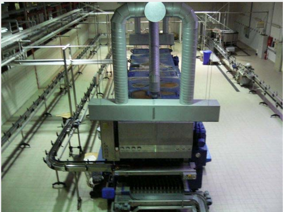
Vista general Instalaciones