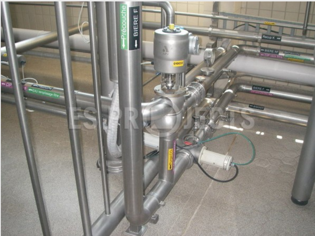
Vannes en version élargie