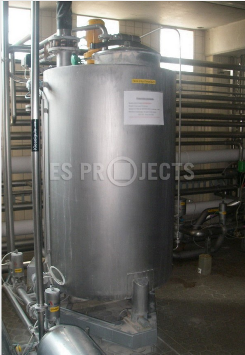
Station de dosage - en version de base