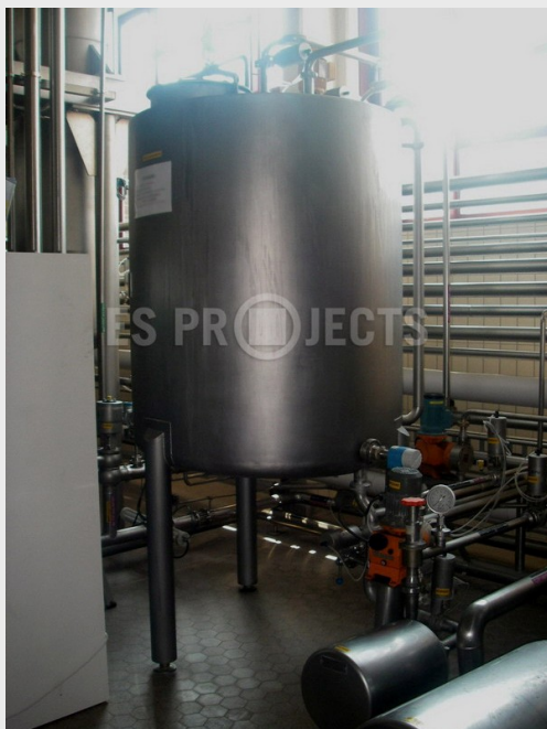
Cuve de dosage additionnel ligne filtration et blending entièrement automatique