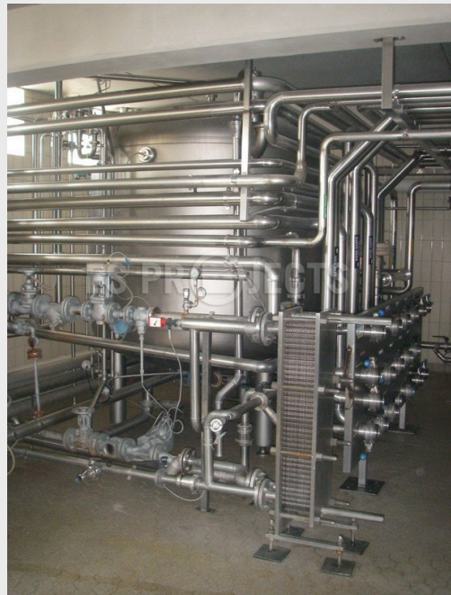
CIP / NEP en version élargie