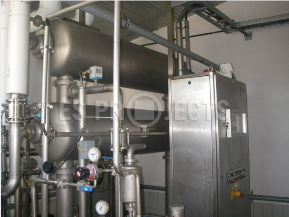
Dégazage d'eau ligne filtration et blending entièrement automatique