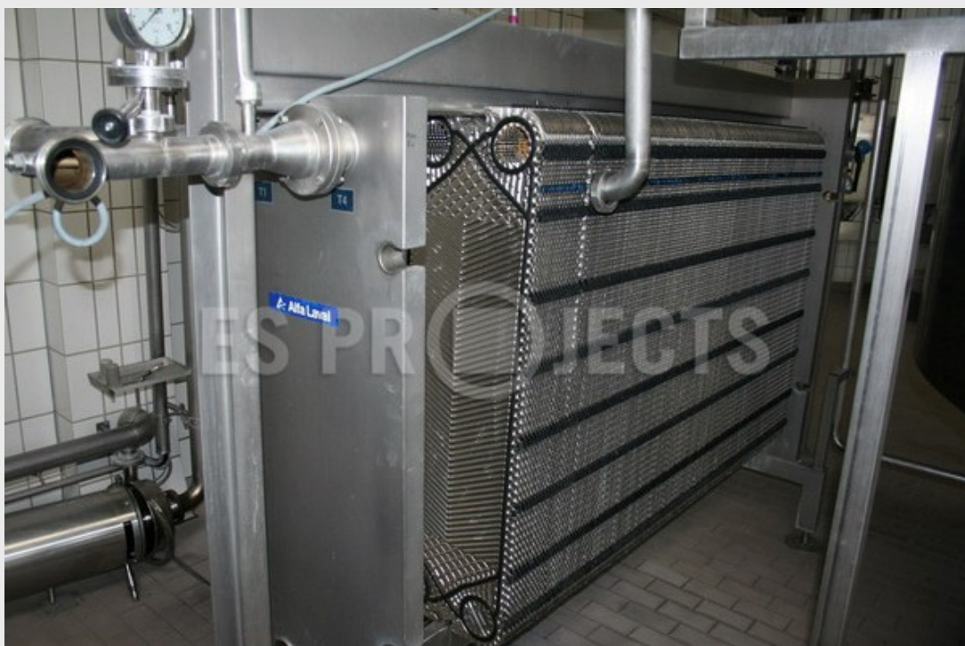
Refroidisseur de mout