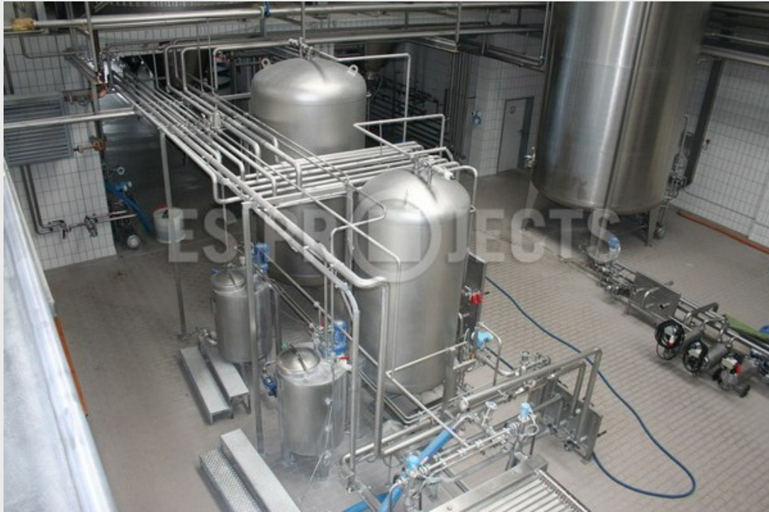
Station de dosage - Tampon