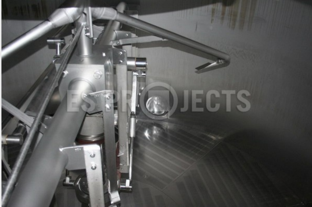
Cuve filtre interne