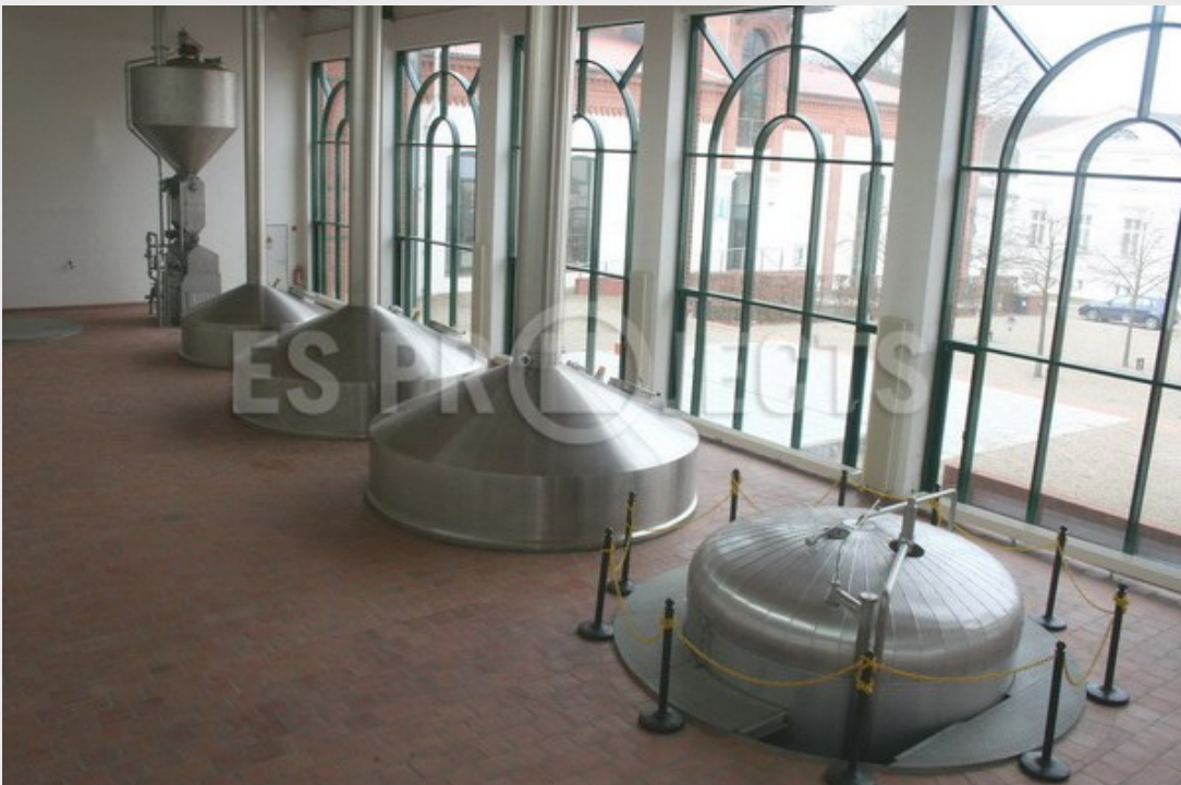
Salle de brassage