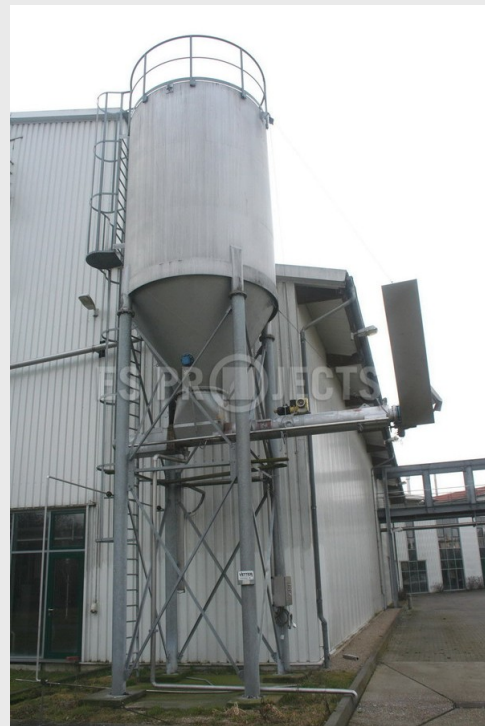
Silo de drèches