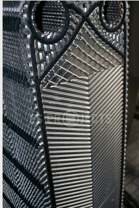
Plate Echangeur de chaleur