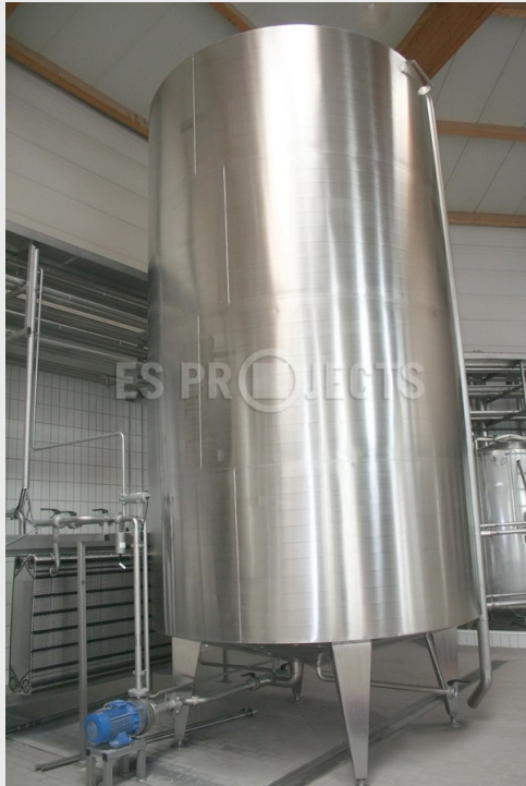
Cuve d'eau glacée