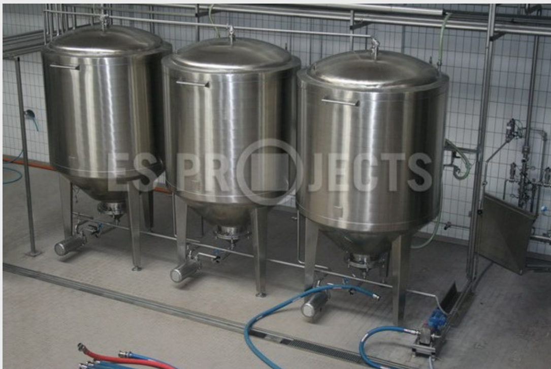
Cuves de levure